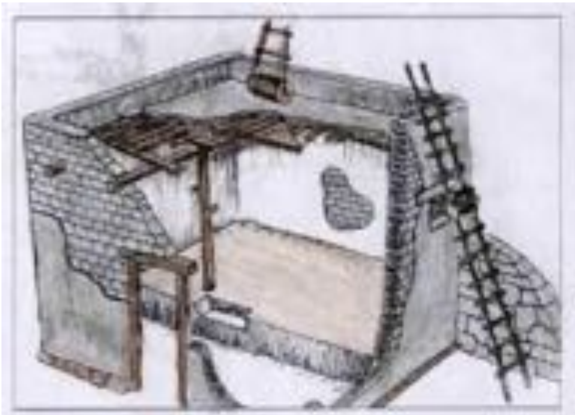
Wohnen zur Zeit Jesus in Palästina

Die Geschichte verliert noch etwas mehr von ihrem Glanz, wenn wir uns die örtliche Situation der Heilung vorzustellen versuchen.