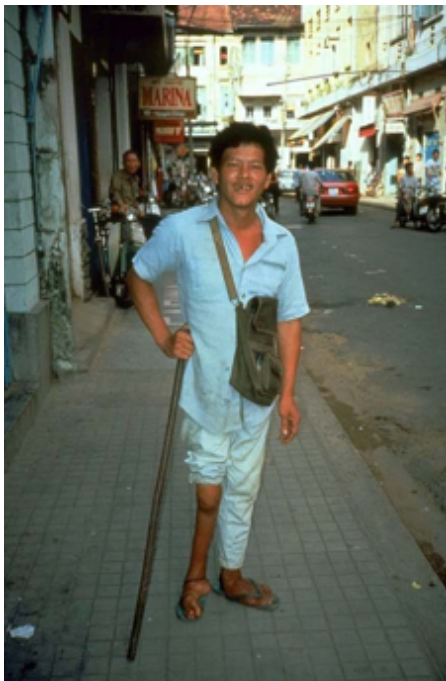
Man on street with atrophy and paralysis of the right leg and foot due to polio ( https://de.wikipedia.org/wiki/Poliomyelitis )