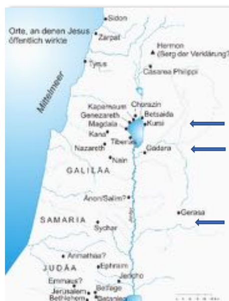
Palästina zur Zeit Jesu

Der Autor der Geschichte schreibt sehr wohlwollend und unkritisch über Jesu Fähigkeit, böse Geister auszutreiben. Ein anderes Licht wirft die Kritik bei Makarios Magnes, APOKRITIKOS 3,4 (Biblical Tools and Studies 30, Seite 117 ff.) auf Jesu Kompetenz bei der Geister-Austreibung. Aus neuplatonischer Sicht müssen böse Geister – weil sie unsterblich vorgestellt sind - in den Untergrund getrieben werden, damit ihre Kraft für die Menschen unwirksam wird. Die Platzierung in der Sauherde wird deshalb als Fehlschlag der Austreibung kritisiert. Der Kritiker legt nahe, dass die neuplatonische Methode den bösen Geistern besser Herr wird als die christliche ( Biblical Tools and Studies 30, Seite 128 ).